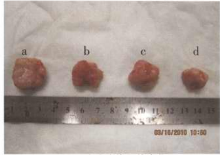
图 1 移植瘤体积的变化

2.2 免疫组织化学法检测各组移植瘤中 COX-2、MMP-7、TIMP-1 蛋白量的表达变化 各组移植瘤